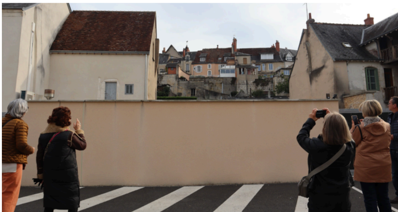
Balade exploratoire. Novembre 2025, Châteauroux.