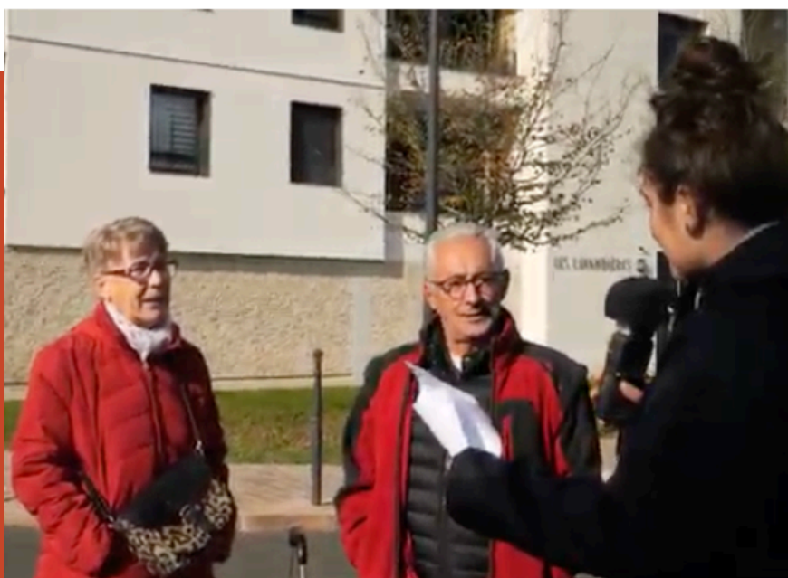
Microtrottoir "Le patrimoine castelroussin, qu'est ce que c'est ? Octobre 2025, Châteauroux.